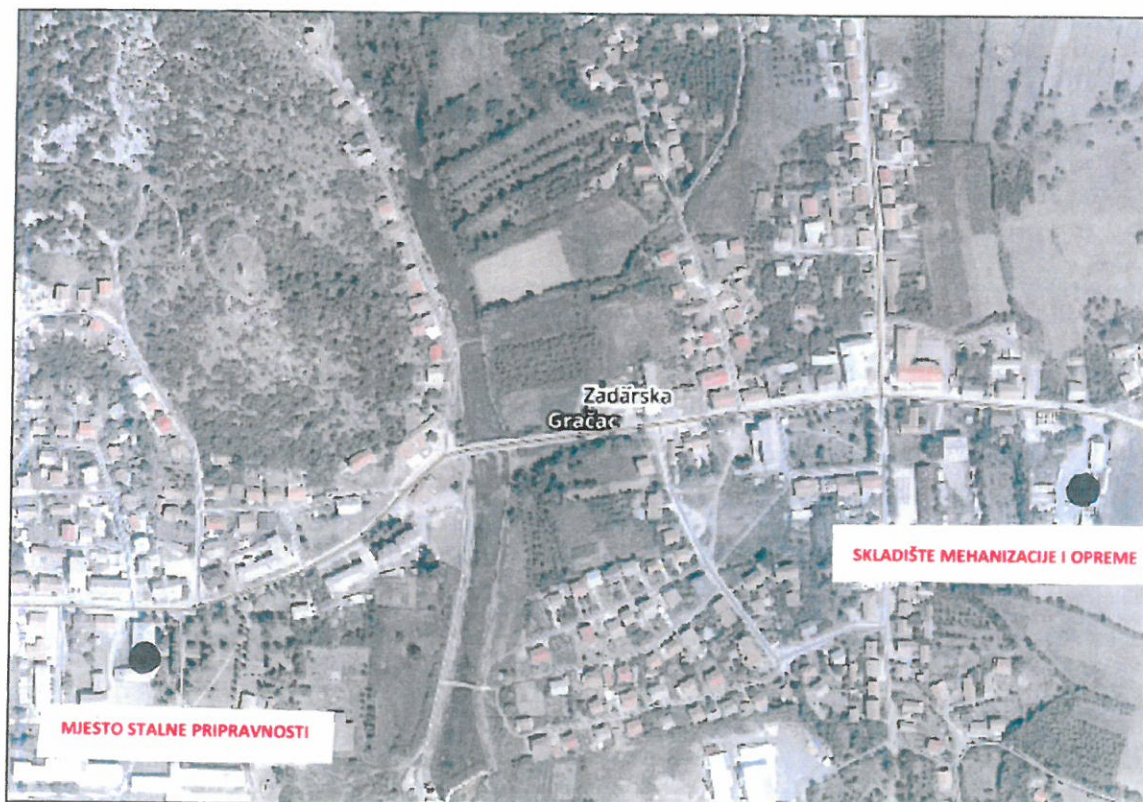
Slika 1. Lokacija mjesta pripravnosti i skladišta materijala i opreme na području Općine Gračac označena na karti DOF Geoportal

Mjesto pripravnosti se sukladno organizacijskim potrebama izvođenja radova zimske službe može ustrojiti i u naselju Srb, o čemu odgovorna osoba Izvoditelja radova donosi posebnu Odluku i o tome izvještava Stožer zimske službe Općine Gračac, odnosno odgovornu osobu Općine Gračac- Općinskog načelnika Općine Gračac.